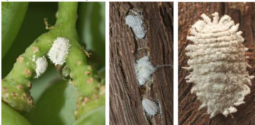
Figura 1. Planococcus ficus (Signoret), femmina adulta

Le pullulazioni sono influenzate da fattori microclimatici (poca luce, scarsa aerazione, elevata umidità), dalla tecnica colturale (laute concimazioni azotate, sistema di allevamento espanso, vegetazione lussureggiante) e anche dalla pressione esercitata dai prodotti fitosanitari sulle popolazioni dei loro antagonisti naturali.